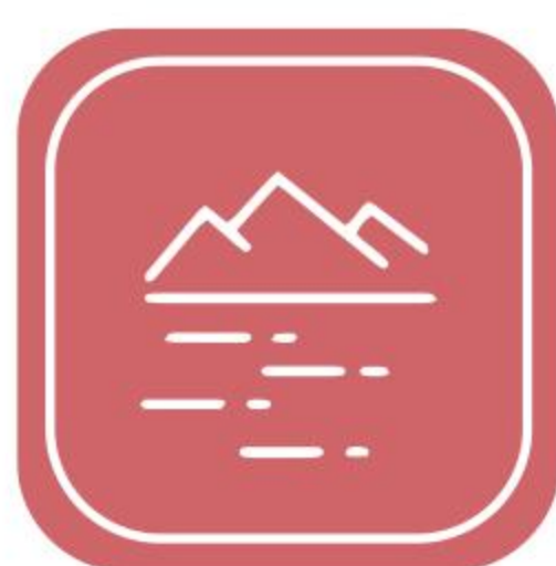
水环境及 村镇污水