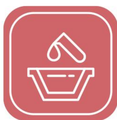
消杀设备 及化学品