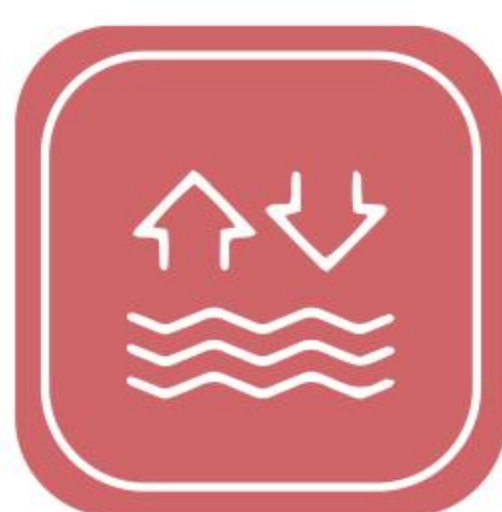
蒸发结晶及 废水零排