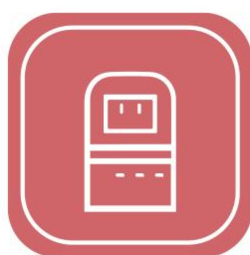
污水设备及 配套产品